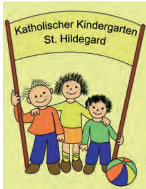
„St. Hildegard“ Marbach